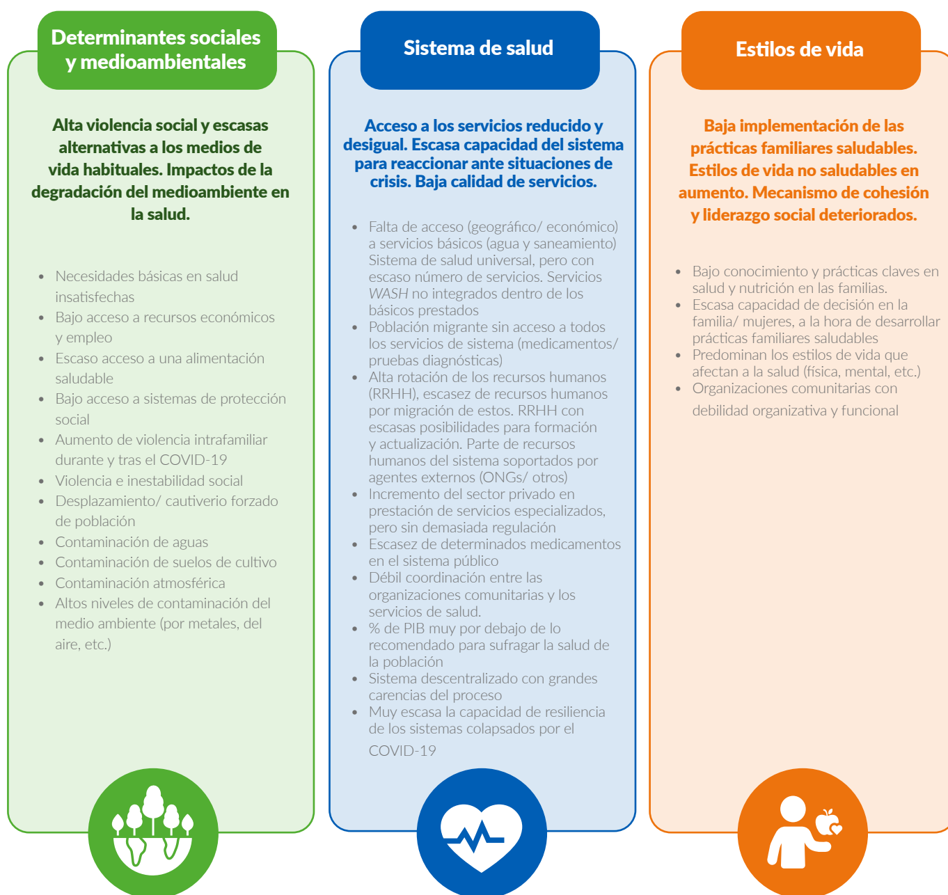
Figura 1; tabla de recogida de análisis sobre acceso población a los servicios básicos de salud en la región.

Desde Acción contra el Hambre hemos analizado las posibles causas por país que impedían a la población contar con una adecuada salud y las hemos agrupado bajo el marco de determinantes sociales.