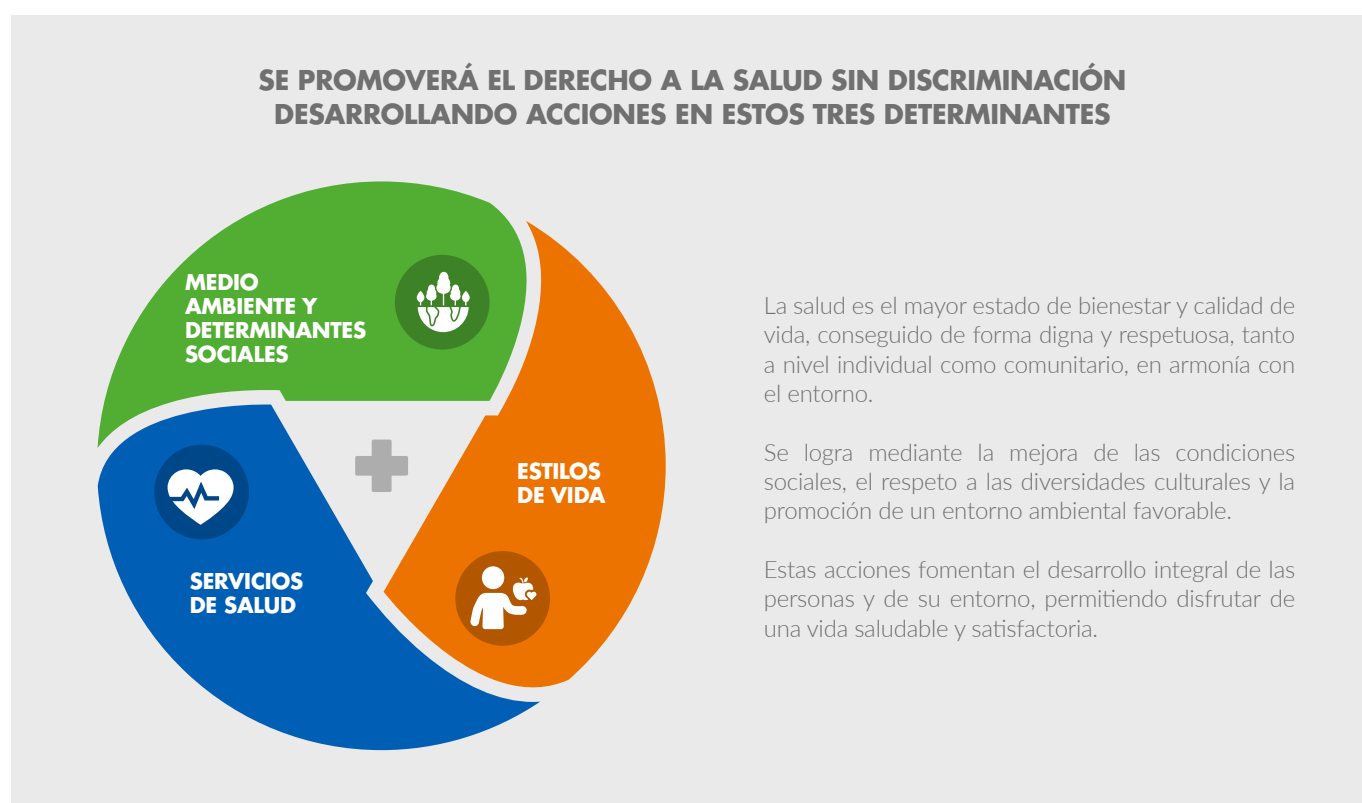
Figura 2; Determinantes de la salud y en enfoque de ACF. Acción contra el Hambre, 2024.

Si tomamos la recomendación de OMS, los determinantes sociales de la salud se desagregan en once 8 . Para la elaboración de este documento hemos seguido de manera interesada por su agrupación el aún vigente marco soñado por Lalonde en 1974, en el que se establecen cuatro grandes grupos de factores o determinantes que directamente están relacionados con la salud 9 . En nuestro abordaje trabajaremos sobre tres de ellos , sobre los que nuestra intervención como organización puede tener un mayor impacto.