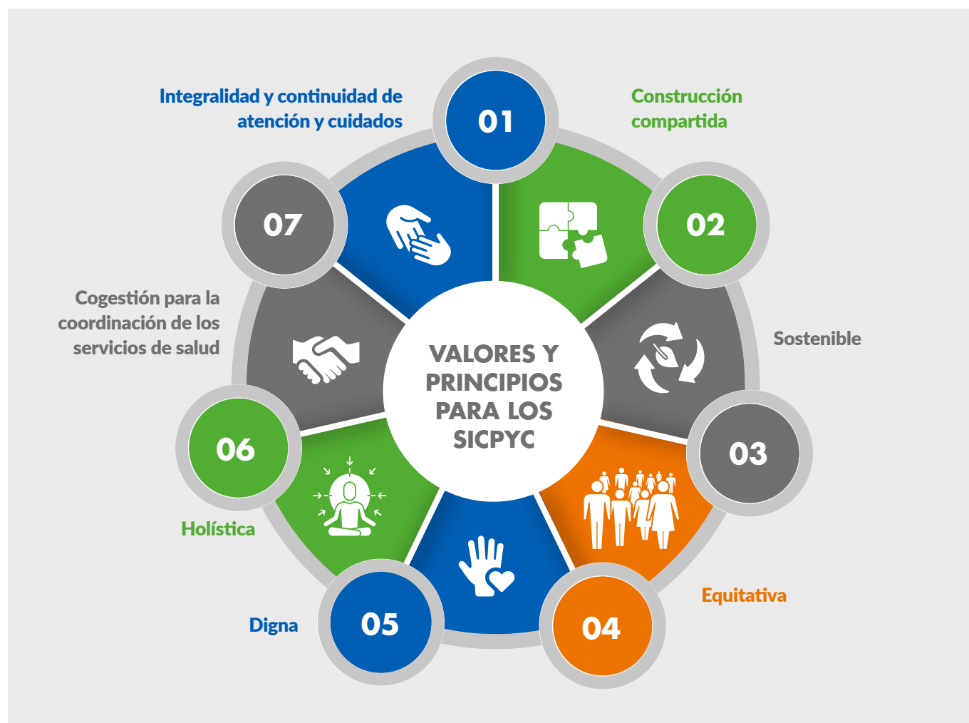
Figura 4; Servicios integrados centrados en las personas y las comunidades (SICPYC).

La OMS/OPS recomienda que los servicios integrados centrados en las personas y las comunidades tengan los siguientes principios y valores en su implementación: 30