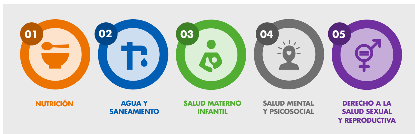
Figura 3; Tipos de servicios dentro del paquete básico para Acción contra el Hambre.

Los servicios básicos en salud que se desarrollarán de manera prioritaria dentro de nuestra acción son los que cuentan con evidencia de un claro impacto en la reducción de la malnutrición: los servicios propios de nutrición, los relacionados con el acceso a agua y saneamiento, los relacionados con la salud materno-infantil, los dedicados a la salud mental y psicosocial de la población incluido el enfoque Nurturing 18 y los servicios relacionados con el derecho a la salud sexual y reproductiva.