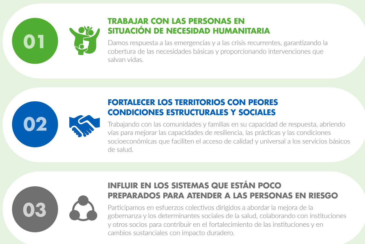
Figura 6; Pilares de acción de la intervención en salud de Acción contra el Hambre en América Latina. Acción contra el Hambre 2024

Sobre estos tres pilares podemos desarrollar un enfoque que no solo se centra en asegurar las necesidades en situaciones de crisis, sino que construye un claro espacio para la continuidad de la intervención basado en la mejora de la gobernanza y en la participación y capacidad de la comunidad.