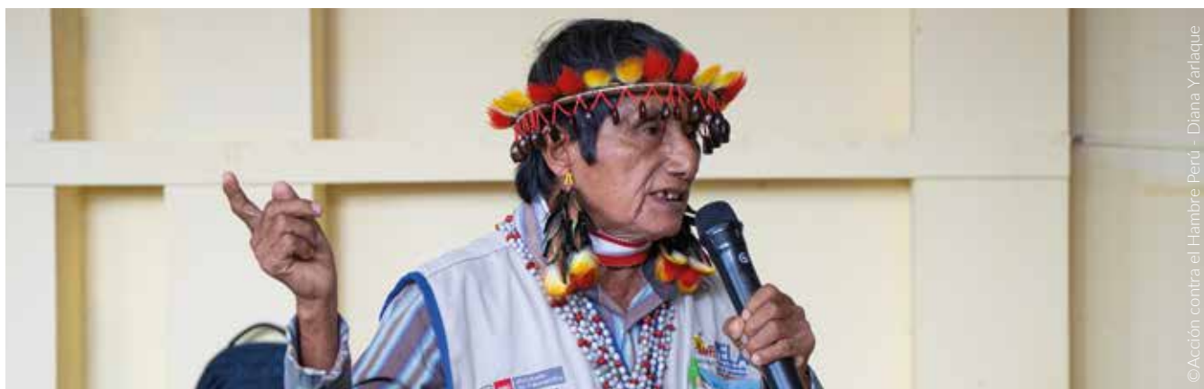
Comunero awajún en el encuentro de líderes y líderes del Bajo Marañón.

“Hay una responsabilidad de informar al pueblo Awajún (...) si informan con palabras técnicas la población los comuneros, la población indígena casi no entienden porque trabajan sin interpretaciones, para hacer una información por la este escrita oral también (...) las autoridades deberían hacerse una información clara traducido también para que puedan escuchar con su propia con su propia idioma”. 39