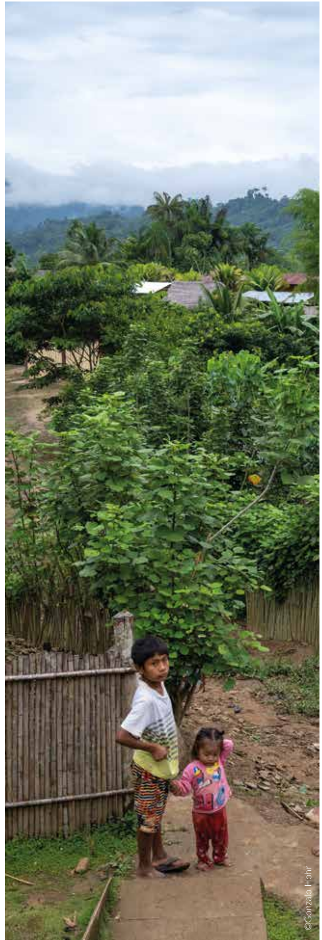
Infantes de la comunidad awajún de Salem.

Finalmente, desde el sector salud, le corresponde a la DIRESA implementar un plan de acción de promoción de la salud y prevención del riesgo frente a derrame o fuga de hidrocarburos con participación de comunidades. Este debe incluir comunicaciones con mensajes a la población en riesgo 4 .