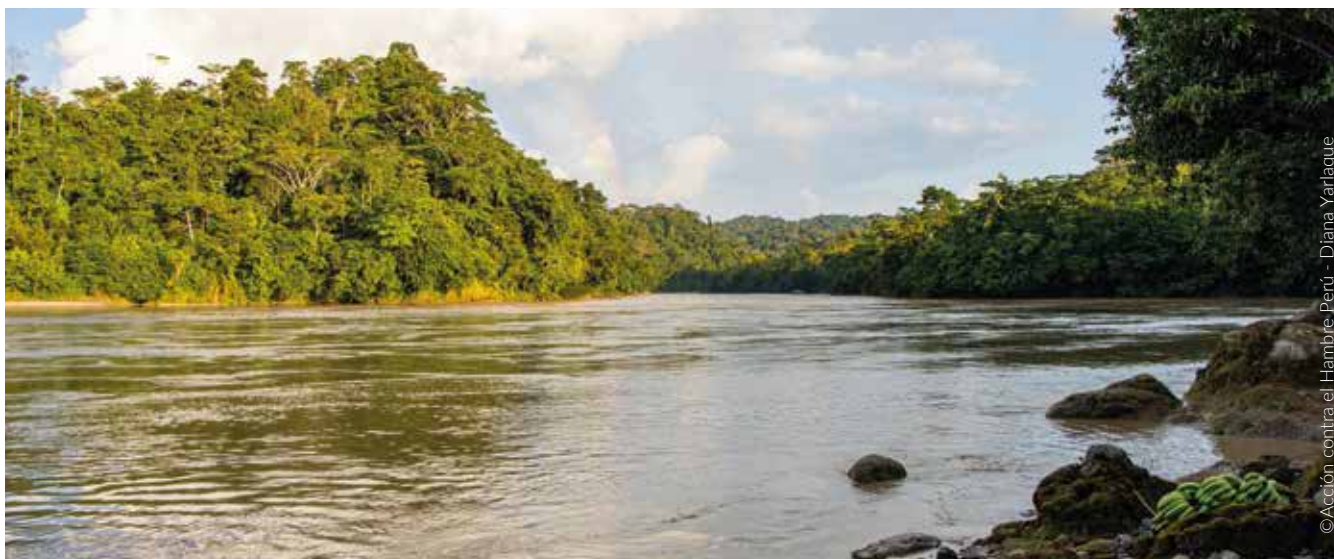
Paisaje de la región de Bagua, Amazonas.

8 años después del derrame, Petroperú aún no remedia de manera adecuada el derrame. Tampoco cumplió con una medida correctiva vinculada a crear un protocolo de comunicación con las comunidades en casos de derrames, aspecto que ya debería tener contemplado en el cumplimiento de la normativa analizada en el segundo capítulo.