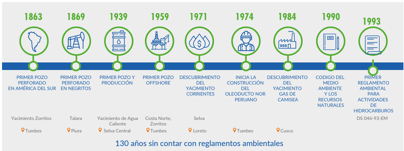
Gráfica N° 1: Antecedentes históricos de las actividades de hidrocarburos en el Perú.

A continuación, una línea de tiempo de los antecedentes de las actividades de hidrocarburos en el país.