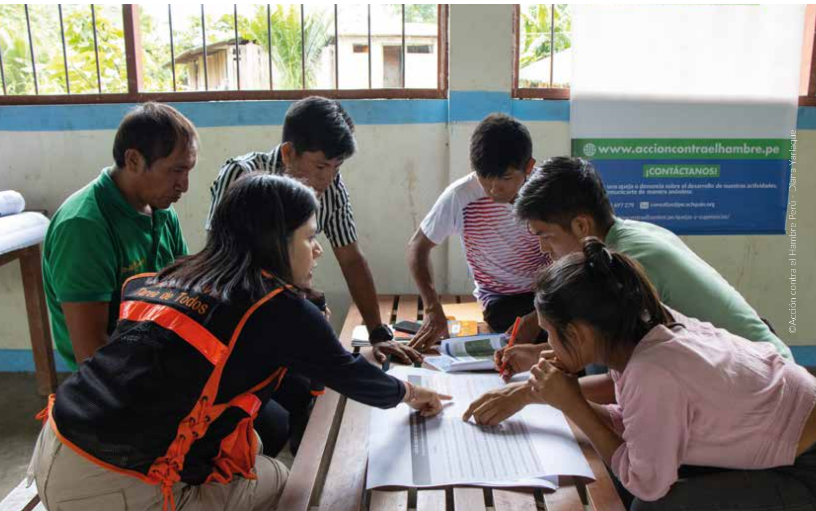
Comunidad nativa Shushui elabora lista de chequeo de sus capacidades en gestión de riesgo.

En tal sentido, urge trabajar en su fortalecimiento interno, así como en el de de sus alianzas, para dotarlos de las herramientas pertinentes que les permitan responder con rapidez ante nuevos impactos, tales como rutas o protocolos ya preparadas para su puesta en acción. A ello se le debe sumar la incidencia a largo plazo que se requiere para lograr la protección y restauración de sus territorios.