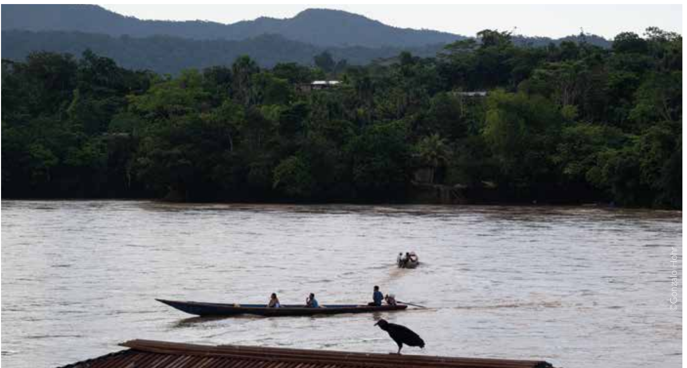
Puerto de Imazita al atardecer, Amazonas