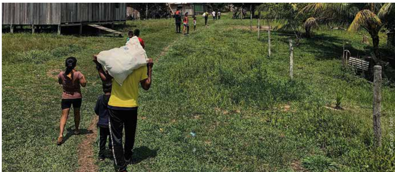
Comunidad awajún de Salem.