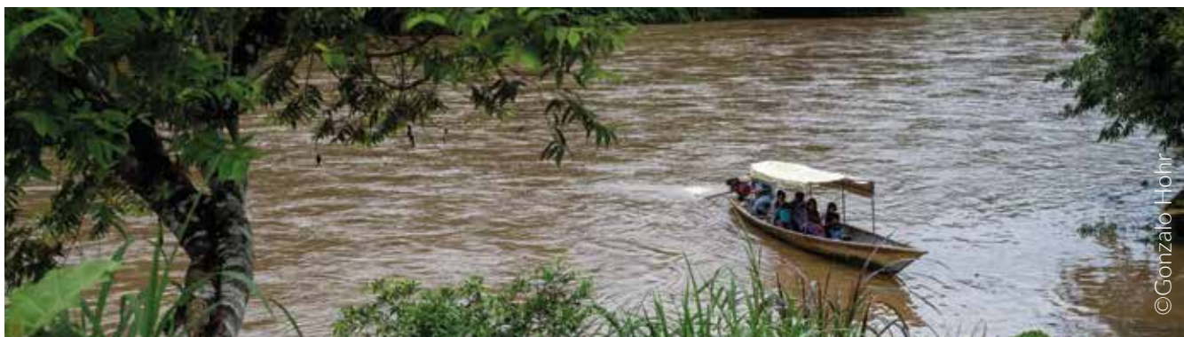
Medio de transporte en la comunidad de Wachapea.