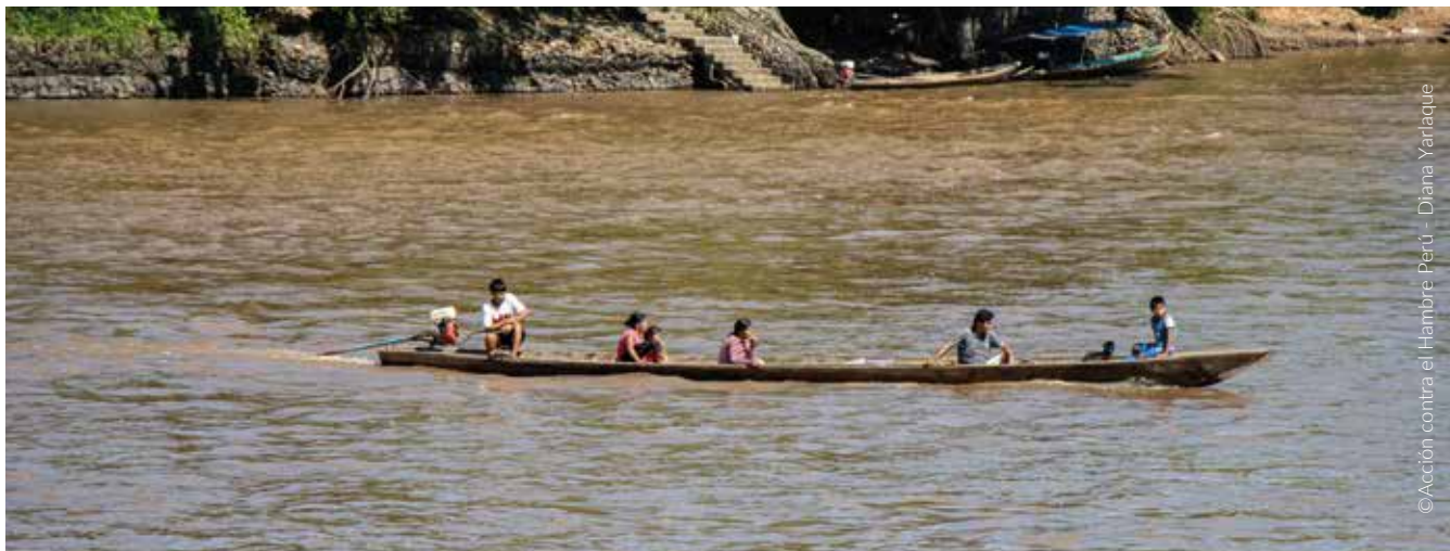
Comuneros en embarcación en el río Nieva, Condorcanqui

Por otro lado, respecto a los procedimientos de Osinergmin, se debe señalar que para el presente informe no se pudo acceder a la información, dado que la entidad comunicó mediante Carta 661-2024-OS-GSE/DSHL del 14-0-2024 que entregaría la información el 12-6-2024.