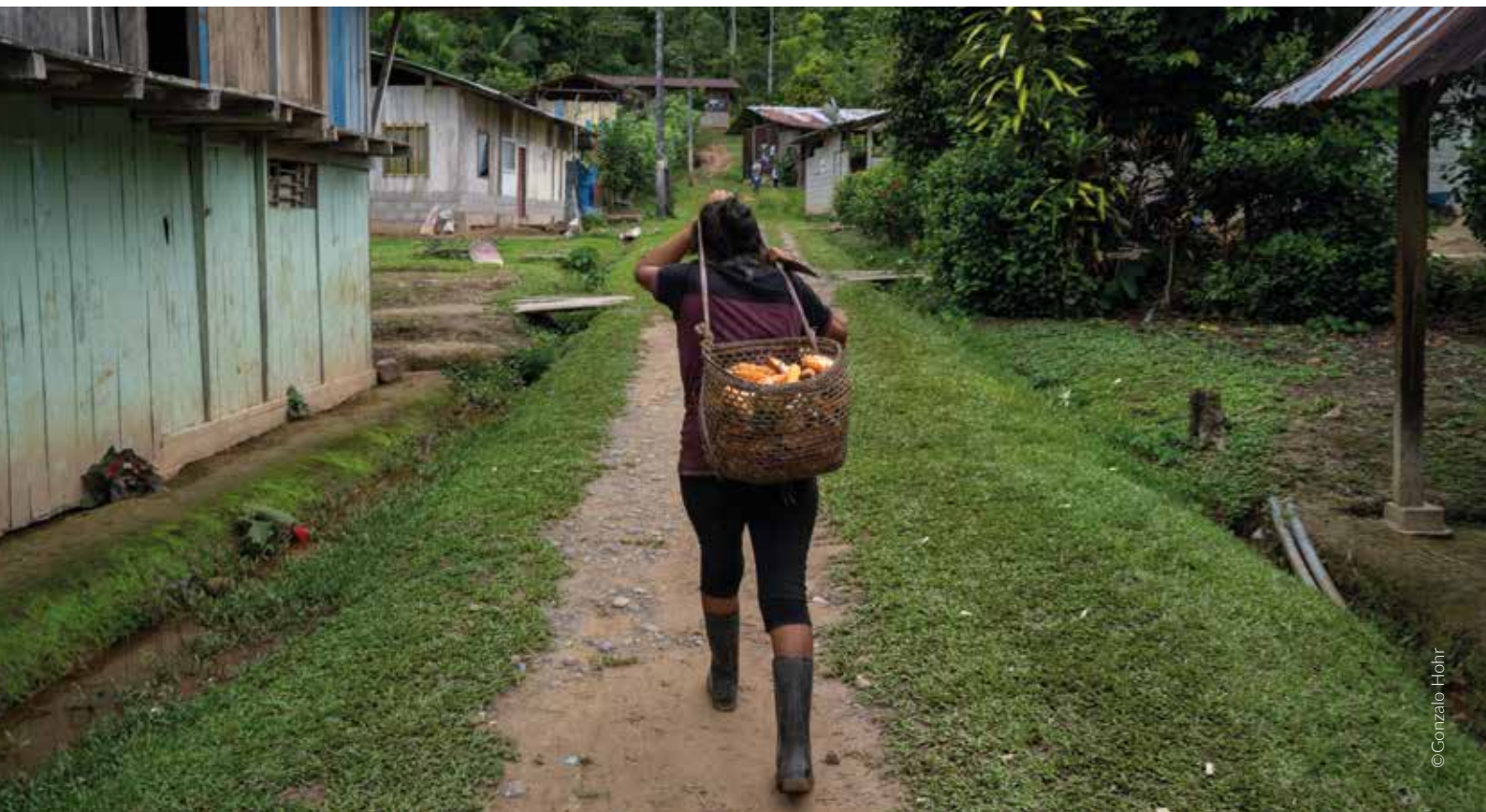
Comunidad awajún Nazareth, Amazonas