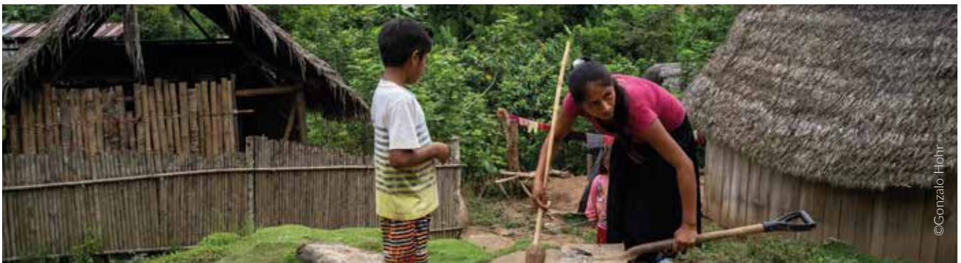
Comunidad awajún Salem, Amazonas

Respecto a las competencias del Osinergmin, este organismo decidió no abrir un Procedimiento Administrativo sancionador de acuerdo a la información entregada.