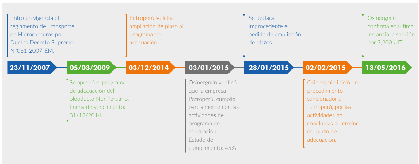
Grafica N°2: Línea de tiempo respecto al proceso de adecuación de ductos del ONP

Se debe resaltar que parte de estas obligaciones responden al proceso de Adecuación de Ductos al Reglamento de Transporte de Hidrocarburos por Ductos, el cual estableció un plazo de 5 años para que las empresas se adecúen a las disposiciones del reglamento. Sin embargo, Petroperú no cumplió. A continuación, una breve línea de tiempo al respecto de este proceso: