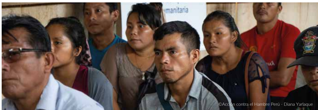
Comunidad nativa Shushui recibe capacitación en gestión del riesgo de desastres.

Finalmente, las políticas de prevención requieren de una política de salud pública y un programa educacional para reconocer y reportar emergencias, ambos impartidos a población general, y difundidos en el idioma de la población. También es necesario implementar medidas para evitar que las comunidades nativas y campesinas se vean afectadas dentro de lo posible, aplicando las medidas para prevenir, minimizar o eliminar los impactos negativos sociales, culturales, económicos y de salud.