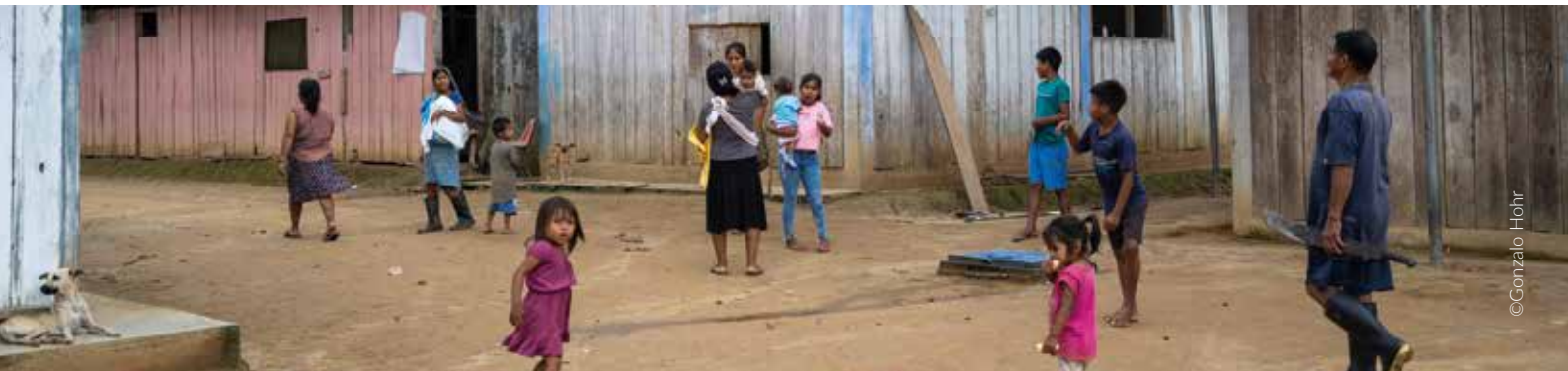
Comunidad awajún Salem, Amazonas