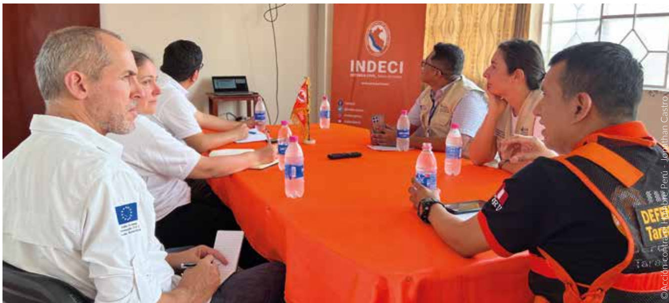
Visita de representante del Servicio de Ayuda Humanitaria y Protección Civil (ECHO), en reunión con las principales autoridades locales y líderes del Gobierno Territorial Autónomo Awajún.

El MINEM y las entidades opinantes que correspondan (ANA, SERFOR, DIGESA, SERNANP, MINAM y MIDAGRI) evaluarán el contenido del PR y formularán observaciones que la empresa debe subsanar obligatoriamente para que se apruebe el PR. De no aprobarse, debe volverse a presentar. Cabe resaltar que, mientras que elabora el PR, la empresa debe seguir aplicando las Acciones de Primera Respuesta que sean necesarias para evitar generación o incremento de impactos.