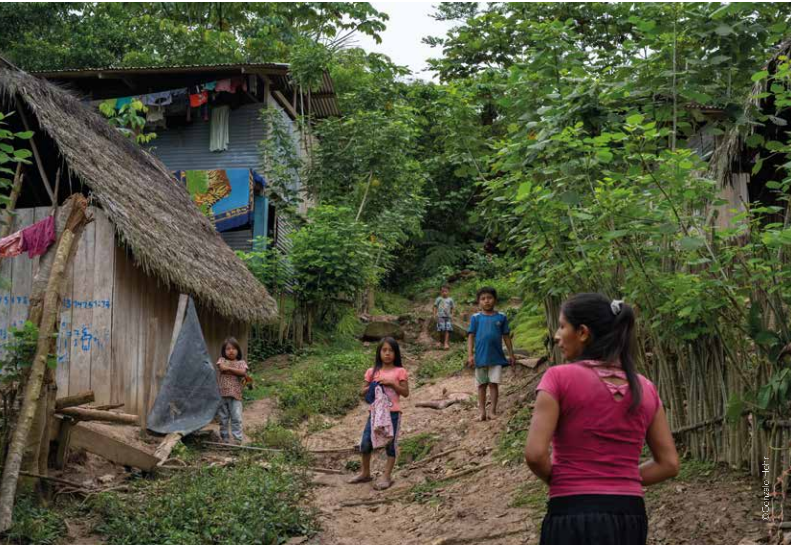
Comunidad awajún Salem, Amazonas